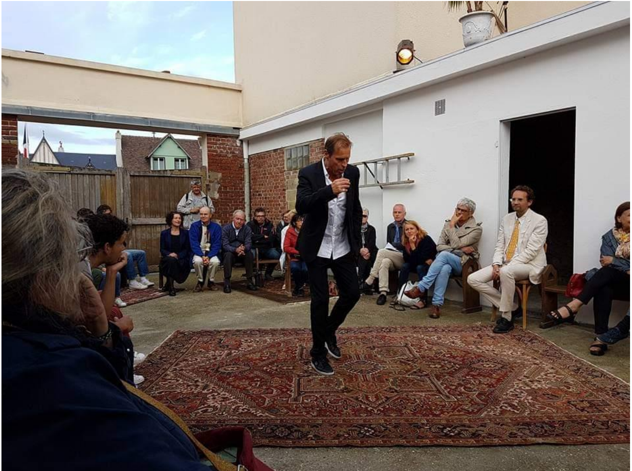
Protagoras dans la cour du riche CALLIAS, festival de Villerville, 2017.